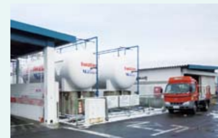
地震直後からLPG車で配送

東日本大震災の被災地では、ガソリン、軽油が不足しましたが、LPG車の燃料補給は確保でき、人員・物流輸送の両面で大いに活躍しました。