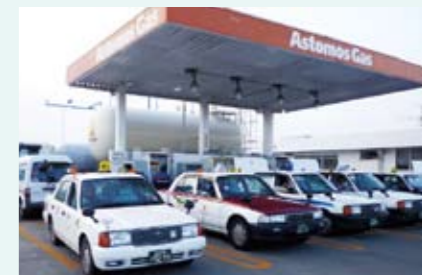
被災地の足、タクシーに燃料供給