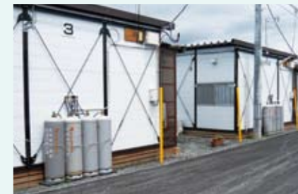
仮設住宅へのLPガス供給