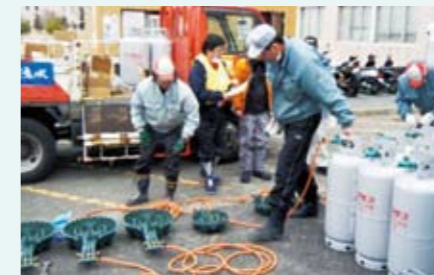
避難所へのLPガス供給

LPガス(プロパンガス)は、地震の被災復旧も早く、分散型エネルギーの利点を生かし、避難所での炊き出しや暖房に活躍しました。