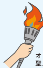
オリンピック 聖火リレー・トーチ