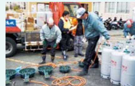
避難所へのLPガス供給

LPガス(プロパンガス)は、地震の被災復旧も早く、分散型エネルギーの利点を生かし、避難所での炊き出しや暖房に活躍しました。