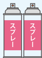
ヘアスプレー等の 噴射剤