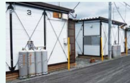
仮設住宅へのLPガス供給