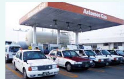
被災地の足、タクシーに燃料供給