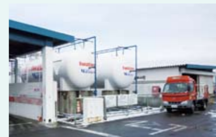
地震直後からLPG車で配送

東日本大震災の被災地では、ガソリン、軽油が不足しましたが、LPG車の燃料補給は確保でき、人員・物流輸送の両面で大いに活躍しました。