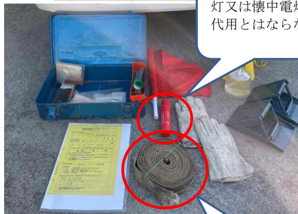
発炎筒は赤色合図灯又は懐中電灯の代用とはならない